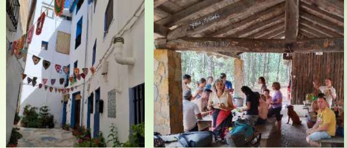
-Casco antiguo de Chelva -Área recreativa.

Nos gustó tanto la excursión del año pasado en Chelva que este año repetimos zona, se visitó el barrio cristinano y judío de Chelva y comimos en el área recreativa "lapuente alta" de Calles.